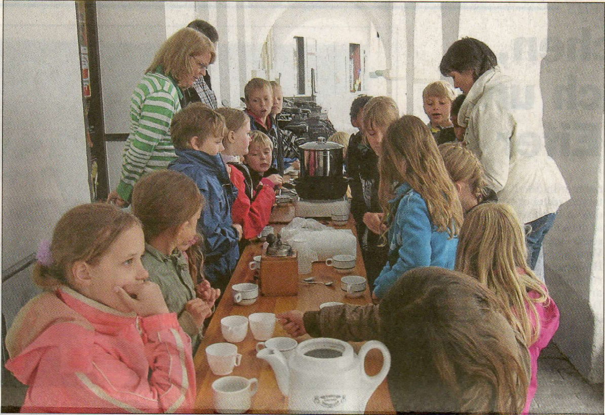
Die Kaffeemühle steht bereit: Vor dem Stadtmuseum haben sich Kinder damit beschäftigt, wie aus der Bohne Kaffee wird.