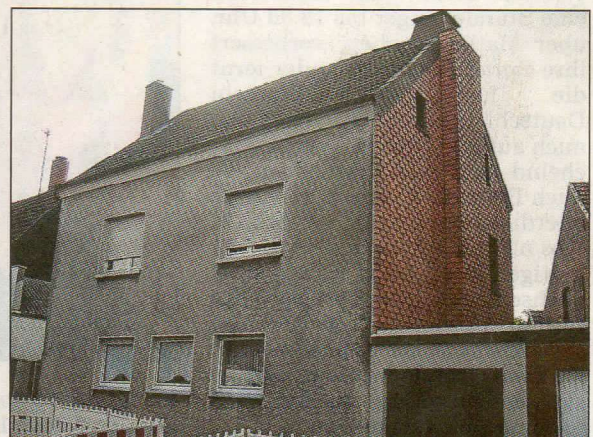
Am Nordwall wurde eine handbetriebene Zichorienmühle verwendet.